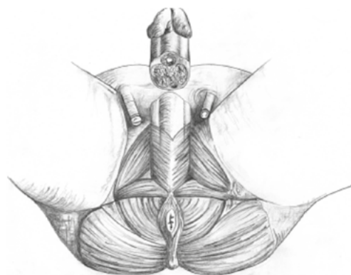
Zeichnung 1: Der Beckenboden

Es wird empfohlen, sich gezielt auf die einzelnen Körperregionen zu konzentrieren, so lernt man den Körper besser kennen und versteht, wie Bewegungen ablaufen und Muskeln zusammenwirken. Besonders am Anfang ist es wichtig, sich zu entspannen, um ein gutes Körpergefühl zu entwickeln. Sie wollen lernen, in Ihren Körper hineinzuhören. Versuchen Sie, den gerade zu trainierenden Muskel in seiner Arbeitsweise zu erspüren und das Zusammenwirken der einzelnen Muskelgruppen nachzuvollziehen. Gehen Sie behutsam vor und steigern Sie die Zahl der Wiederholungen langsam. Jedes Individuum ist anders.